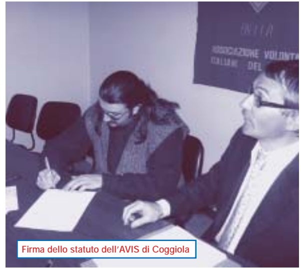
Firma dello statuto dell'AVIS di Coggiola

l'accettazione del candidato donatore, in vigore da maggio 2005; nella prossima uscita provvederemo invece alla pubblicazione dei nuovi patti sociali. Chi fosse interessato può prenderne visione facendo una visita in sede dove sono depositati i verbali e i nuovi patti. Infatti, come più volte auspicato da queste pagine, anche la visita in associazione, magari per scambiare due chiacchiere, permette di rinsaldare le conoscenze ed i legami di amicizia fra i donatori.