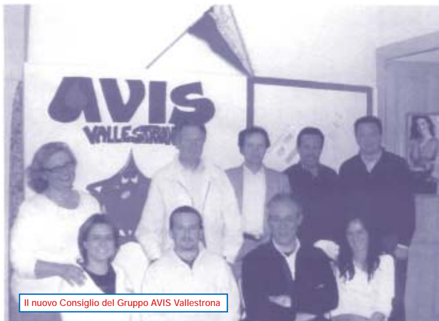
Il nuovo Consiglio del Gruppo AVIS Vallestrona