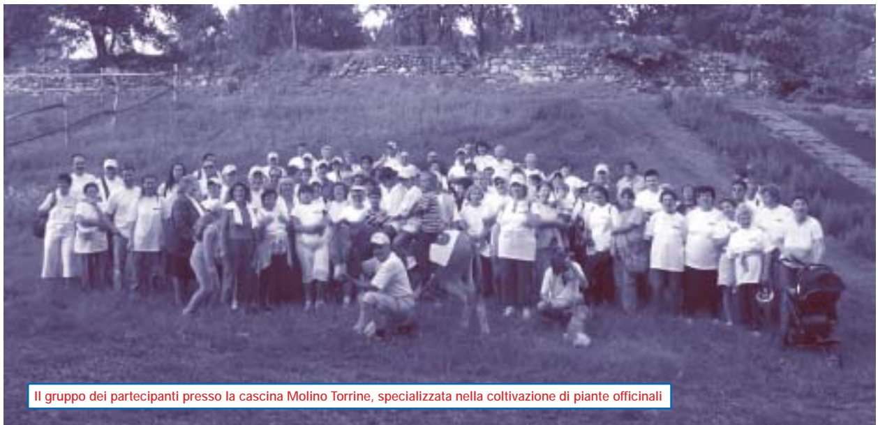
Il gruppo dei partecipanti presso la cascina Molino Torrino, specializzata nella coltivazione di piante officinali