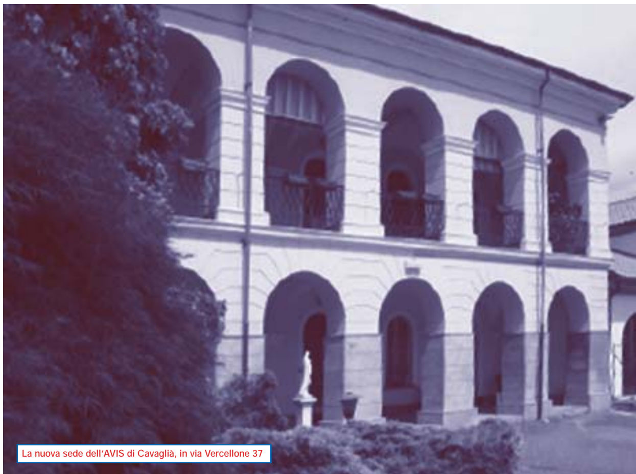
La nuova sede dell'AVIS di Cavaglià, in via Vercellone 37

Vicenza e Ville Venete per il 29 maggio '05