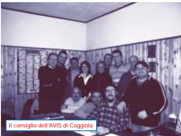
Il consiglio dell'AVIS di Coggiola

Durante questi primi mesi del 2005 l'AVIS Comunale di Coggiola ha continuato il lavoro intrapreso dal direttivo precedente per farsi conoscere meglio all'ester-