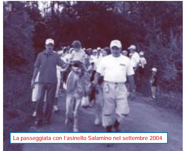
La passeggiata con l'asinello Salamino nel settembre 2004

Accorrete numerosi per poter passare una bella giornata tra storia, natura e gastronomia. •