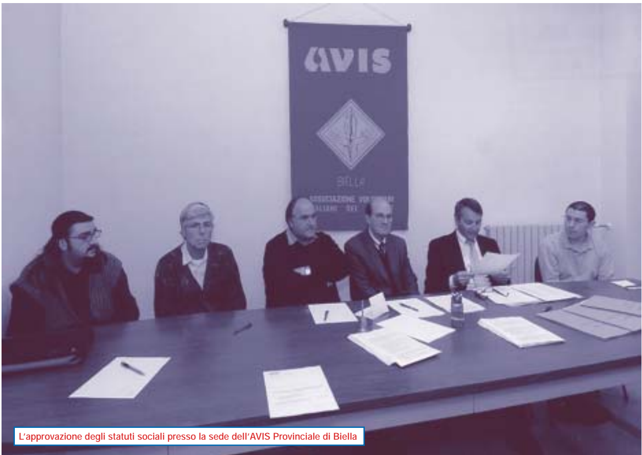
L'approvazione degli statuti sociali presso la sede dell'AVIS Provinciale di Biella

In questo numero del giornalino abbiamo voluto dare risalto alle modifiche intervenute nei requisiti fisici per