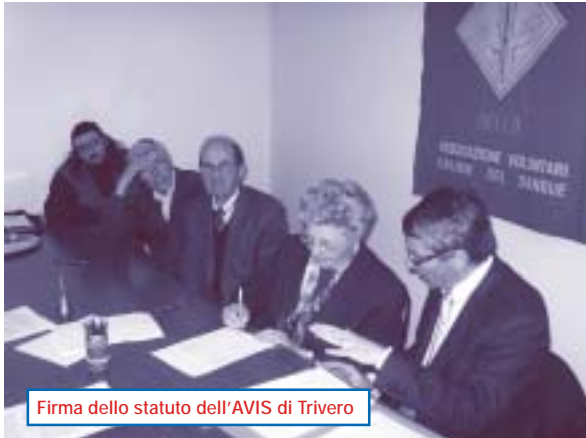
Firma dello statuto dell'AVIS di Trivero

l'accettazione del candidato donatore, in vigore da maggio 2005; nella prossima uscita provvederemo invece alla pubblicazione dei nuovi patti sociali. Chi fosse interessato può prenderne visione facendo una visita in sede dove sono depositati i verbali e i nuovi patti. Infatti, come più volte auspicato da queste pagine, anche la visita in associazione, magari per scambiare due chiacchiere, permette di rinsaldare le conoscenze ed i legami di amicizia fra i donatori.