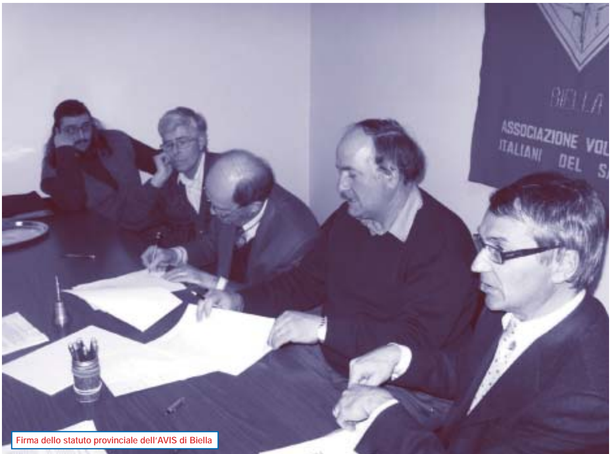
Firma dello statuto provinciale dell'AVIS di Biella